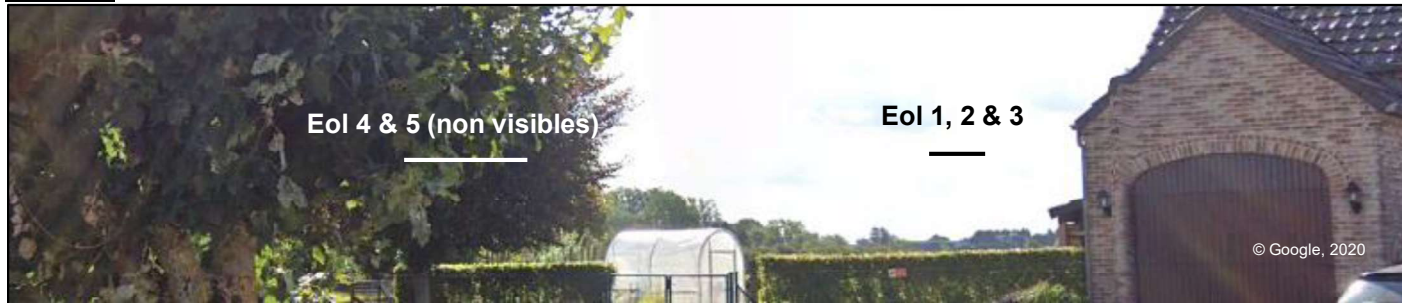
Figure 107 : Panorama depuis la rue de Libersart, Libersart.

Communes de Chaumont-Gistoux, Walhain et Incourt