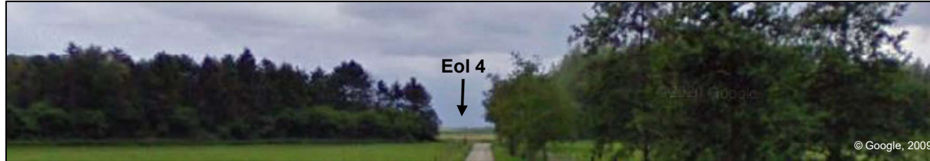
Figure 135 : Panorama depuis la rue de la Commune, Opprebais.